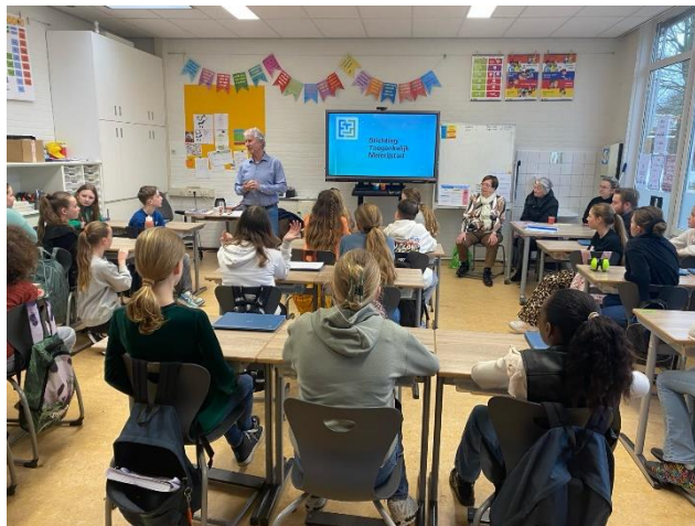
3) Leerlingen vol aandacht bij intro van het scholenproject in Schijndel.

De werkgroepen hebben elkaar in de uitvoering ondersteund met menskracht en materiaal.